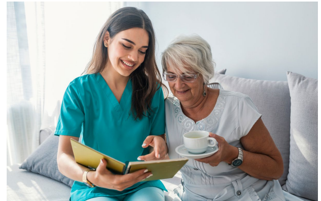
Thực hiện chăm sóc